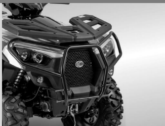
BUMPER NOIR MAT KA-01-0628