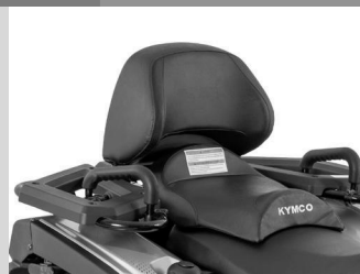
KIT CONFORT PASSAGER KA-01-0639