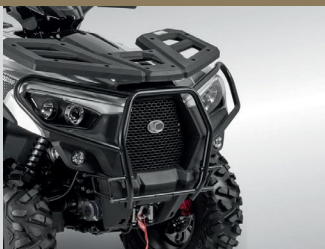
BUMPER NOIR MAT KA-01-0628