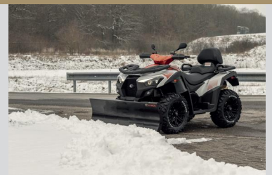
LAME A NEIGE ET AGRICOLE 1400 mm + SUPPORT Pour MXU 500 / 550 / 700 KA-01-0380