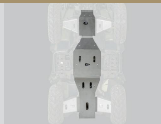
PROTECTION CENTRALE (AVANT ET ARRIERE) KA-01-0363